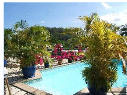
piscine dans la résidence