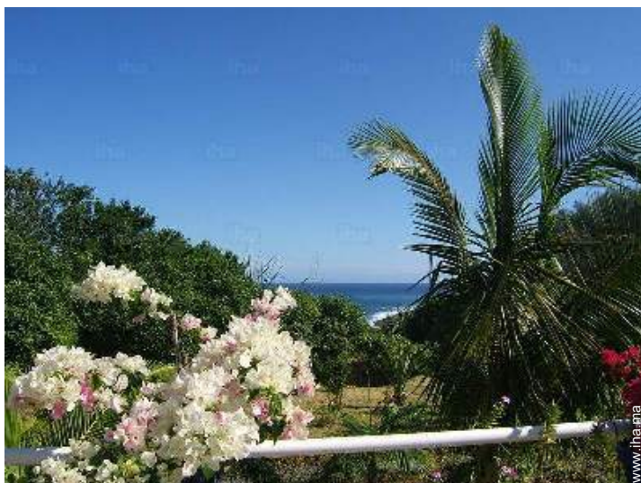
vue depuis la piscine