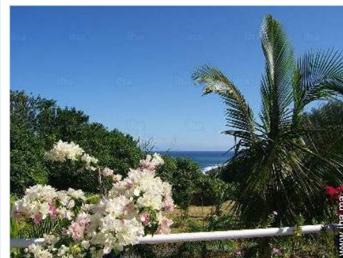
vue depuis la piscine

Centre ville 800m Arrêt/station de bus 800m Location de voiture 300m Boulangerie 800m Petits commerces 500m Super marché 800m Boutiques de luxe et marques 1km Salon de coiffure 500m Cyber café 15km Poste 1km Banque 800m Distributeur automatique de billets 1km Pharmacie 500m Médecin 800m Hôpital 800m