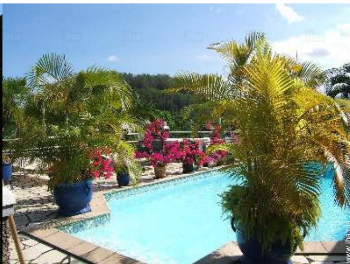
piscine dans la résidence