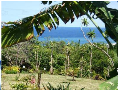
vue depuis le jardin/parc