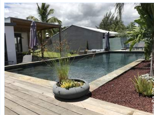
vue depuis la piscine

Centre village 800m Location de vélo/VTT 1km Location de moto/scooter 1,5km Location de voiture 2km Location de bateau 2km Location de matériel de plongée 2km Boulangerie 1km Traiteur 1km Petits commerces 800m Super marché 1,5km Salon de coiffure 1km Poste 1,5km Banque 800m Distributeur automatique de billets 800m Pharmacie 1km Médecin 1km Infirmière 1km Hôpital 10km