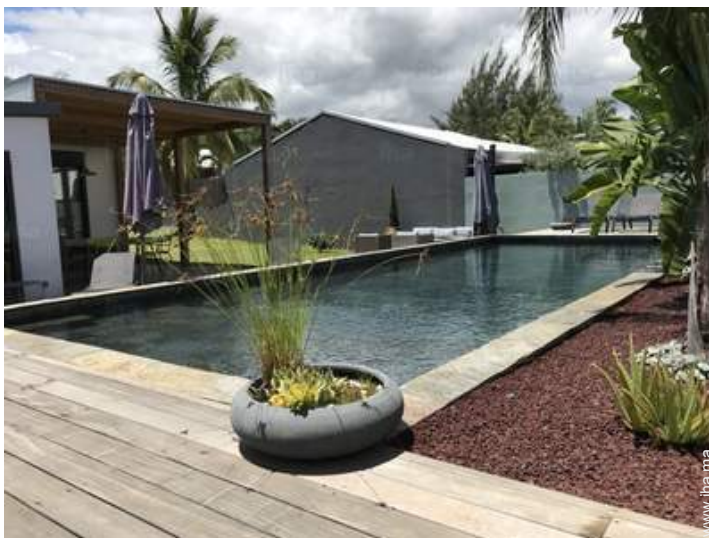
vue depuis la piscine