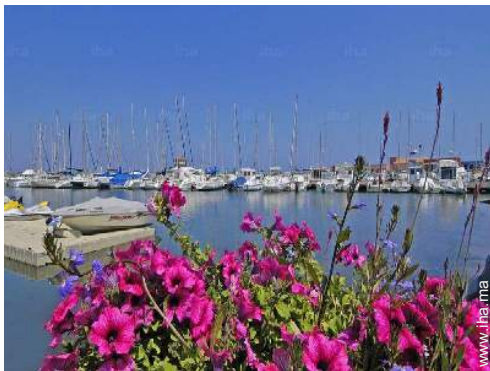
port de plaisance