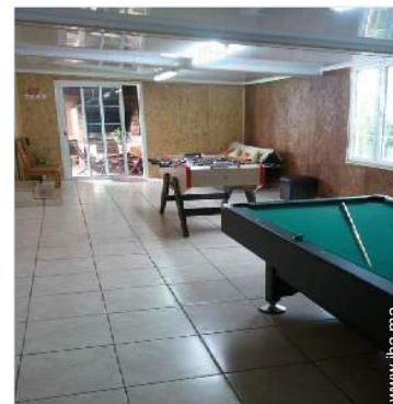
salle de jeux