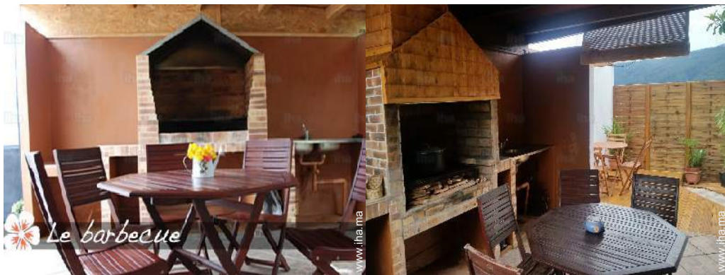
vue depuis la terrasse couverte