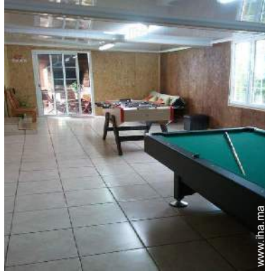
salle de jeux