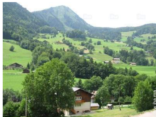
vue sur montagne