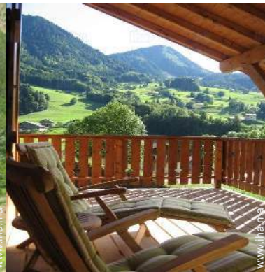
vue depuis le balcon