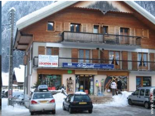
location de matériel de ski