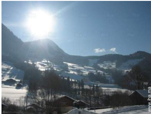
vue depuis le balcon